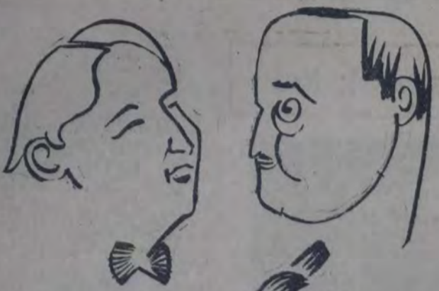
EL NOTABLE DUO DE GUITARRA Y CANTO

Así nuestra insignificancia dentro del orden universal justifica su existencia y nos asegura la posesión de un caudal hereditario capaz de acercarnos en el tiempo y en el espacio a nuestros semejantes.