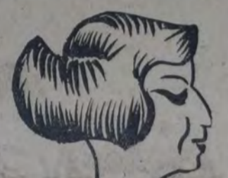
QUE BAILO ADMIRABLEMENTE varias danzas norteñas.

Zapatilla fuerte a ver si nos convidan con aguardiente.