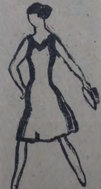
UNA ACTITUD DE JULIA PUIGDENGOLAS.

En otras, el estribillo ocupa casi la totalidad de la copia. El ejemplo citado por Ricardo Rojas, el tomo 1.º de la "Literatura Argentina": "Los gauchos", ilustra al respecto: