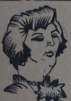
LA DELICADA INTERPRETE DE canciones nativas.